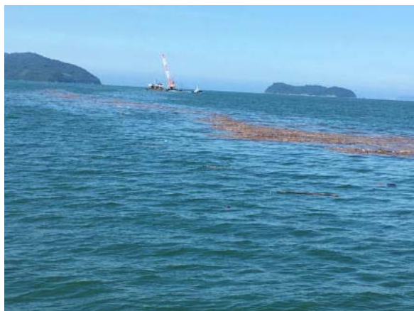
下松地区 ゴミの帯